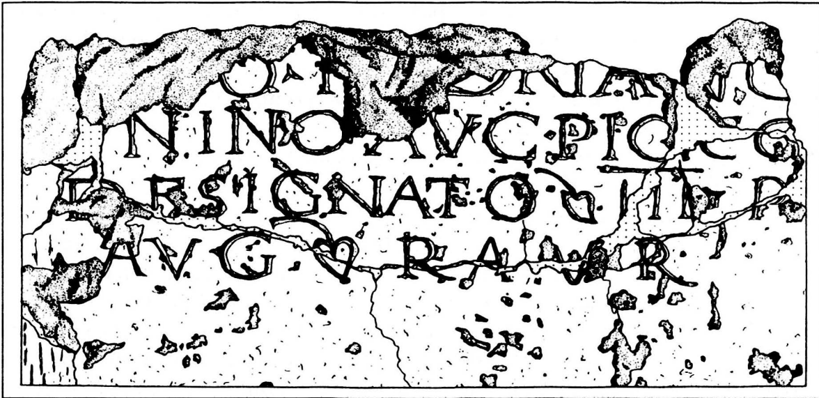
Abb. 2. Nachzeichnung der Meilenstein-Inschrift des Kaisers Antoninus Pius (aus Hans Sütterlin, «Miliaria in Augusta Raurica», Jahresberichte aus Augst und Kaiseraugst 17, 1996, 81).

Fundort: Augst BL, Hohwartstrasse . Funddatum: 10. April 1995 . Standort: Römermuseum Augst, Gross-Steinlager . Material: Kreidiger Rauracienkalk . Erhaltungszustand: Der obere Teil der Säule fehlt. Auf der Rückseite und im Sockelbereich ist sie beschädigt. Die Inschrift weist mehrere z.T. durchgehende Risse auf. Die Rückseite der Säule ist im Gegensatz zur geglätteten Oberfläche des Inschriftenfeldes roh belassen . Masse: Höhe mit Sockel 158 cm, Durchmesser 54 cm, Sockelhöhe 25 cm . Schriftfeld: Breite abgerollt 120 cm . Buchstabenhöhe: 5,5–6,3 cm .